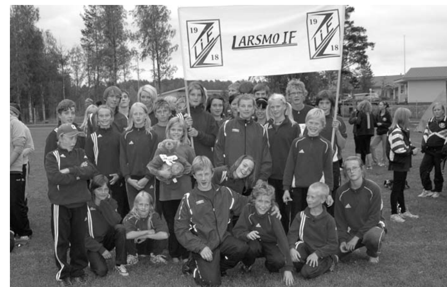
Larsmo IF:s lag i Vattenfall cup finalen i Karstula 2009

Sommarträningarna börjar i maj och inleds alltid med terrängcupen. Vi arrangerar också Ärevarvet i början av sommaren. Träningarna hålls tisdagar och torsdagar på sportplanen i Larsmo och då i grupper indelade efter ålder. De yngsta (6-9 år) tränar en gång i veckan, medan de äldre erbjuds 2 tränings-