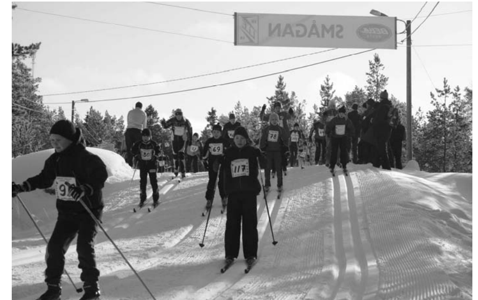
I början av loppet passerar skidlöparna "Smågan". Loppet år 2009.